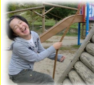
からだを動かして遊びます★