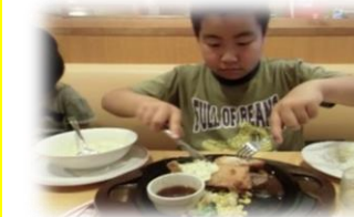
レストランでお食事♥