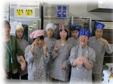
お仕事の体験をします♪