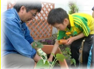
植物のお世話をします★